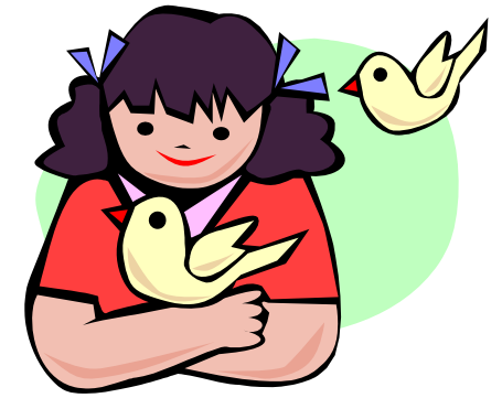
Susi Faber leány