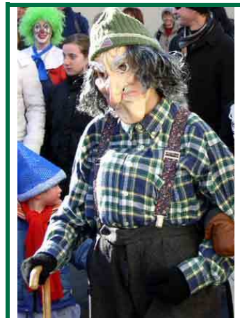
alter Mann ◆