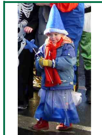
gute Fee *