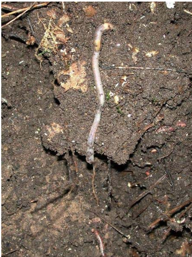
Regenwürmer sorgen für eine Durchlüftung des Bodens