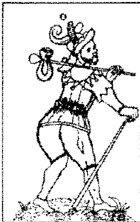
Jackl. der Zauberer